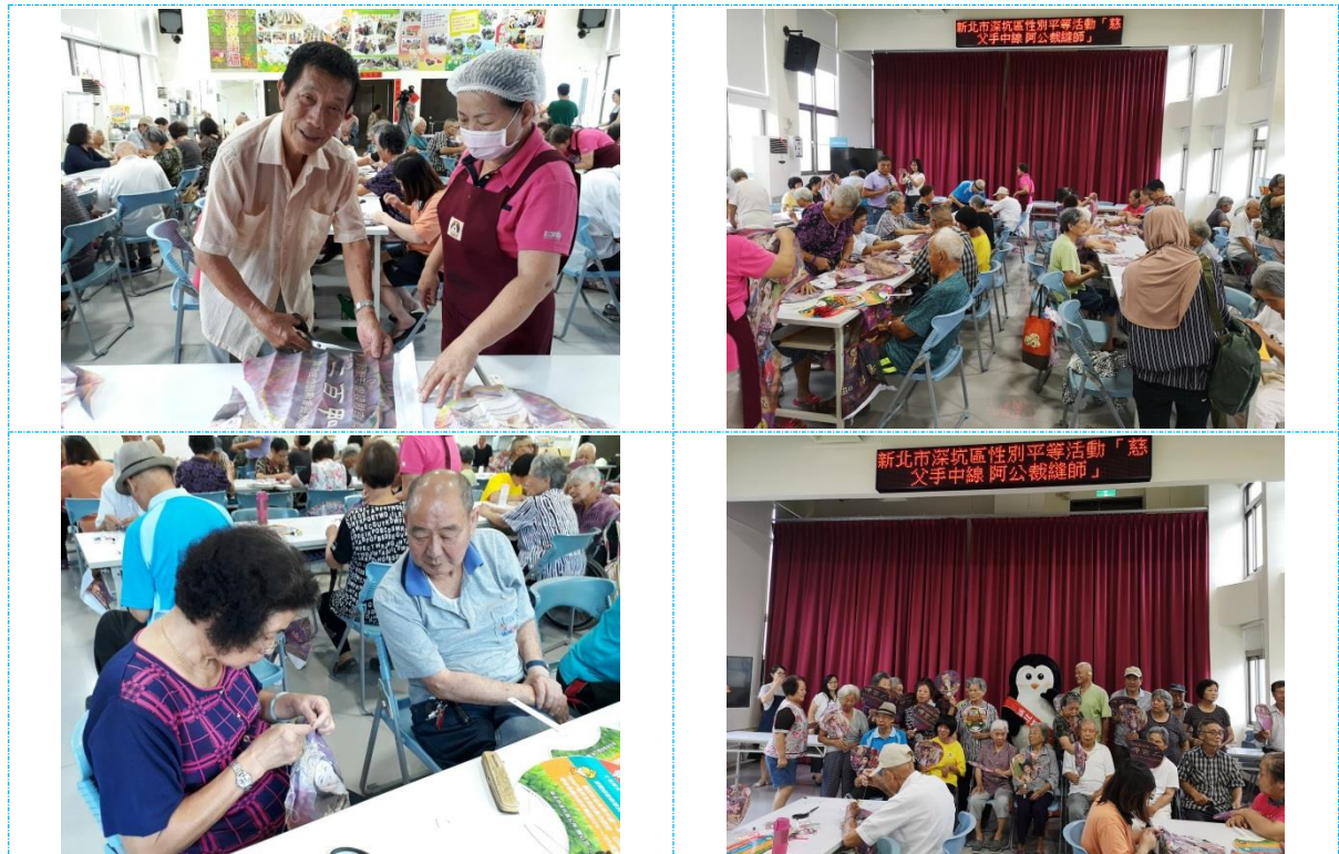
圖 4-6：會員大會配合宣導