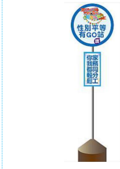
圖 3-4：四寶文化節「性別有 GO 站」