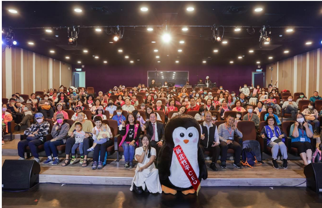
112 年 性別平 等活動 — 「2023 新北市 深坑區 桐花小 旅行」

綜上，本次活動多數參與者為中高齡長者，約 9 成受試者 5 題皆選擇具性別意識的選項，可推估本區性別平等的宣導效果顯著，即使是受傳統性別刻板印象影響較深的長者，現階段也具備性別平等的觀念，未來將持續推廣各項性別平等相關知識，將性平融入生活之中。